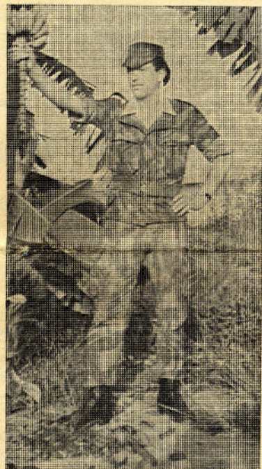
Soldado Policia Aérea