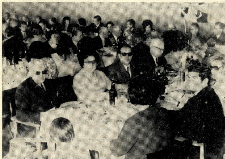
Almoço do 35.º Aniversário da Casa de Pedrógão Grande, realizado em Troia Grande — Hotel Arribas — no dia 8 de Dezembro de 1968